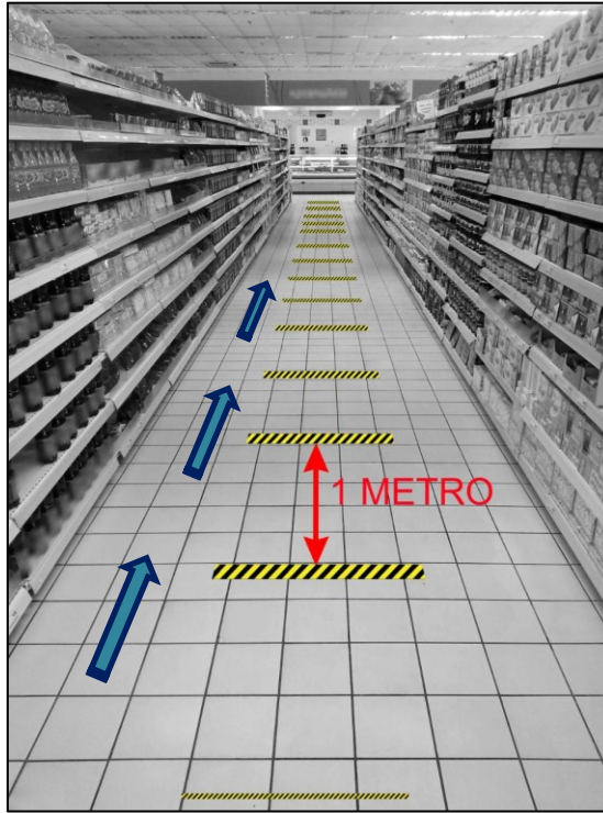
Imagen: las líneas amarillas achuradas con negro permiten señalar la distancia de 1 metro que se debe mantener entre personas. Las flechas azules deben indicar una única dirección de tránsito, que deben tomar las personas según la ruta de desplazamiento determinada por el supermercado.